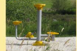
22 Fahrrad / Stepper