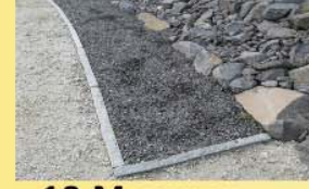
13 Mayener Basalt 0-32mm