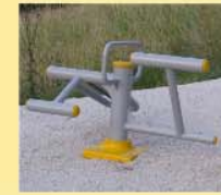
6 Bauch-Rücken Station