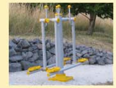
8 Nordic Walker