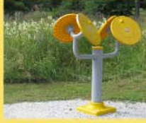
18 Schulter-, Nackentrainer