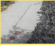
10 Quarzit-Splitt 2-5mm