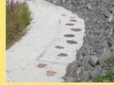
12 Schotter 32 Holzplaster