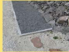
11 Basalt-splitt 8-16mm